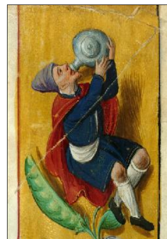
Douai, BM, ms. 112

Consacré au patrimoine écrit ancien et contemporain, le festival aura cette année comme fil conducteur le thème « Des mots, des mets ». Seront ainsi exposées des oeuvres aussi variées que des enluminures médiévales aux allures de festin (manuscrits originaux issus des Bibliothèques Municipales du Nord), des calligraphies latines illustrant des recettes de cuisine, ou même réalisées à base de sucre et chocolat... Un délicieux parcours sur le chemin des lettres et de la gourmandise, qui mettra à l'honneur la langue française, la littérature culinaire et la gastronomie.